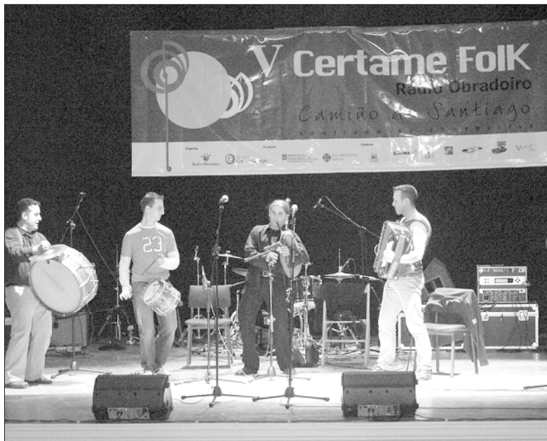
O grupo durante a súa actuación na final do V Certame Folk, no Teatro Principal